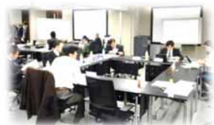
未来産業想像カレッジの風景

会社、業種という既存の枠を超えた議論を楽しむ中から、未来へ向けた新たな産業やビジネスの着眼を発見したい方、異業種とのつながりを持ちたい方は、ぜひご参加ください。皆様のご参加をお待ちしております。