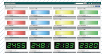
WEB画面 カウンター一覧