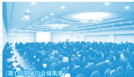
(第1回開催の会場風景)

経営者(生産担当役員)、生産技術担当者、製造管理者、改善担当者、TPM推進担当者、人材教育担当者